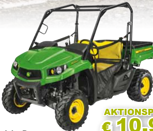
John Deere GATOR XUV 560 E