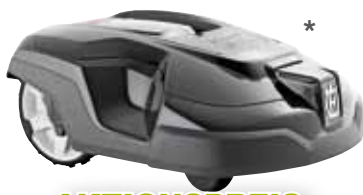
Husqvarna Automower® 310

Effizienter Mähroboter mit intelligenter Technologie, Mähfläche bis zu 1.000 m 2 , max. Steigung 40%, Li-Ionen Akku, Wechselcover als Zubehör erhältlich.