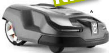
Husqvarna Automower® 315X

Effizienter Mähroboter mit intelligenter Technologie, Mähfläche bis zu 1.600m 2 , max. Steigung 40%, Li-Ionen Akku, Wechselcover als Zubehör erhältlich.