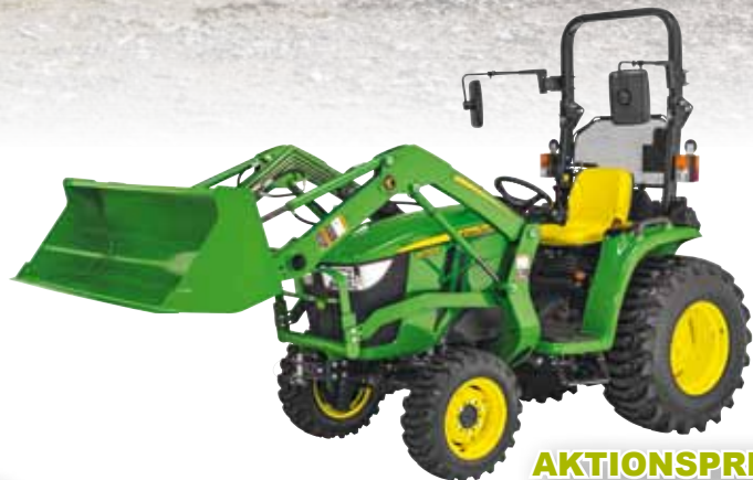
John Deere 3038E mit Frontlader

Spritziger Offroader! Der neue GATOR XUV 560 E Benzinmotor mit stufenlosem 2-Gang-CVT-Getriebe mit voll integrierter Kupplung. Fahrgeschwindigkeit bis zu 45 km/h, Zuladung 363 kg. Inkl. StVZO-Ausrüstung mit Tageszulassung, Überrollbügel und Hochleistungs-Mehrzweckbereifung.