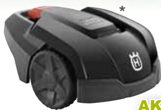
Husqvarna Automower® 105

Natürlich installiert er Ihnen den neuen Mähroboter auch gleich und weist Sie in die Bedienung ein. Außerdem steht er bei Fragen oder im Servicefall zur Verfügung!