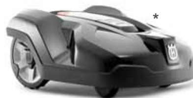
Husqvarna Automower® 420

Ultra-leiser Mähroboter für komplexe Rasenflächen, kann mit Automower® Connect aufgerüstet werden, Mähfläche bis zu 2.200 m 2 , max. Steigung 45%, Li-Ionen Akku.